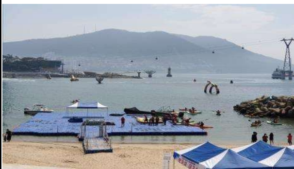
센터 앞 계류장