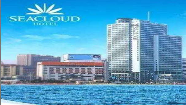
해운대해수욕장에 위치한 호텔