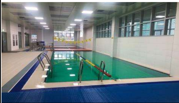
센터 내 다이빙 풀